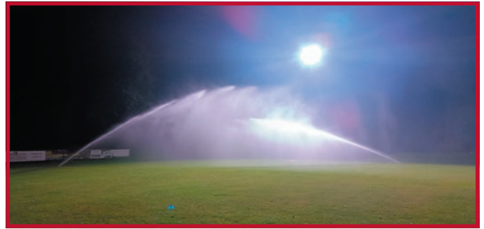
Auf den Rasenspielfeldern wurde 2024 eine automatisierte Beregnungsanlage eingebaut.