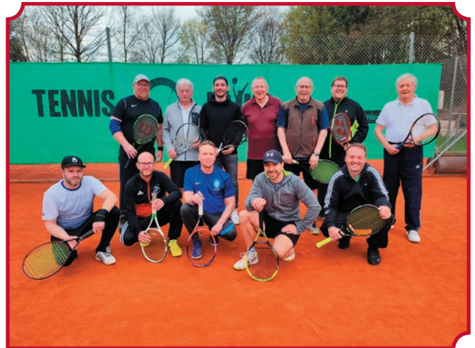
Tennisturnier Alt und Jung