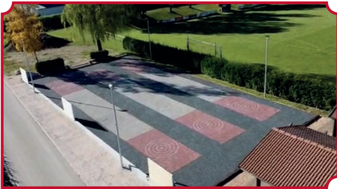
Die Stockbahnen wurden mit sehr gut bespielbarem Pflaster erneuert.