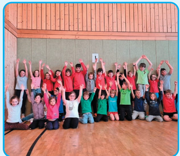
Foto der Teilnehmer der Minimeisterschaft.

Auch 2025 war die Minimeisterschaft ein voller Erfolg. Die Kinder hatten großen Spaß und viel Freude!