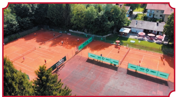
Der Zaun der Tennisanlage wurde aufgrund eines Sturmchadens erneuert.