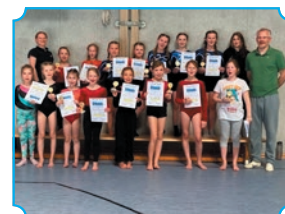
Bad Endorf 2023

Die Teilnahme am jährlichen Kinderturnfest in Bad Endorf war und ist nach wie vor immer ein Highlight, für das es sich zu trainieren lohnt. Dort müssen die Mädchen am Boden, Balken, Sprung und Reck Pflichtübungen in verschiedenen Schwierigkeitsgraden bewältigen. Nach einer Corona-Pause von drei Jahren findet das Kinderturnfest seit 2023 wieder regelmäßig statt.