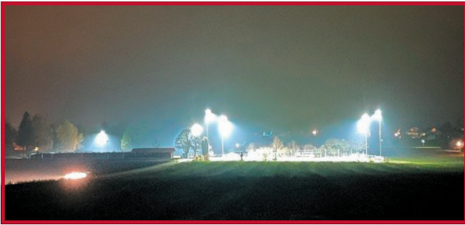
Auf dem Haupt- und Trainingsplatz sowie den Stockschützenbahnen gab es neues LED-Flutlicht.