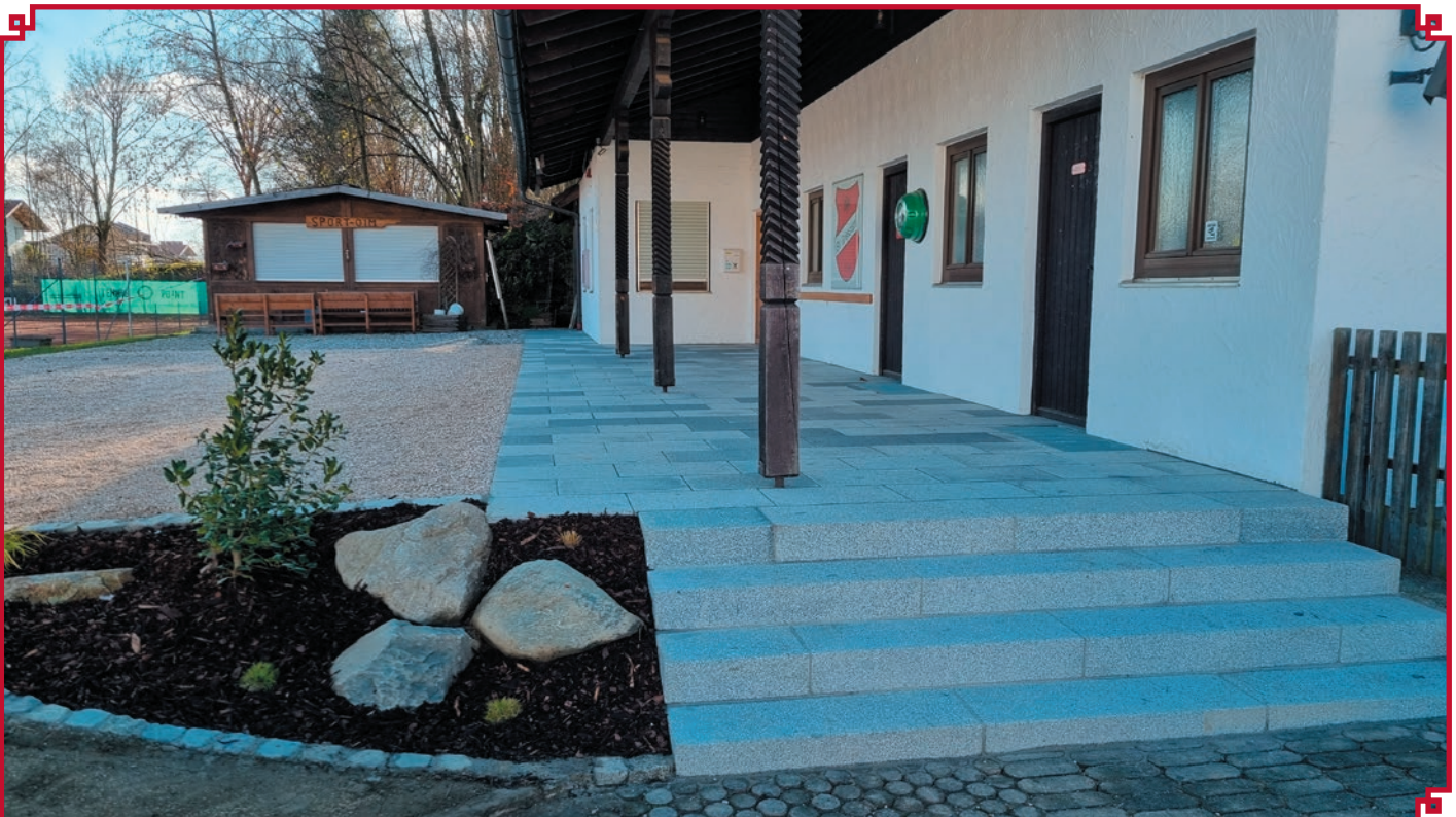
Die Sportheimterrasse hat einen neuen, rutschfesten Belag.