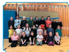
Bad Endorf 2024