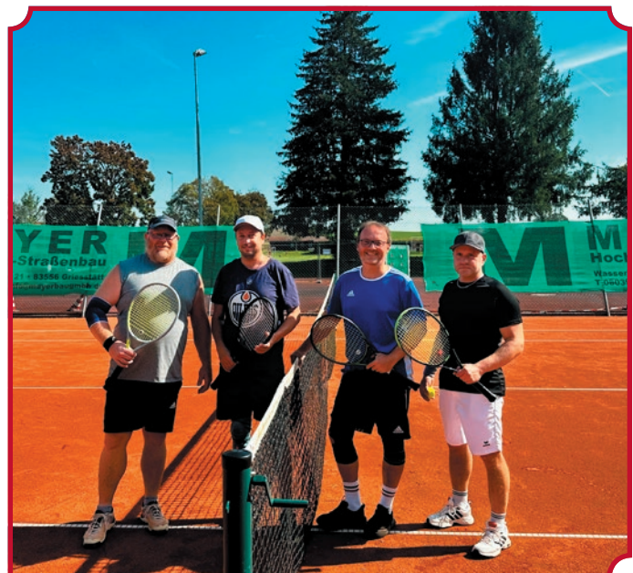
Vereinsmeisterschaft Doppel Finale